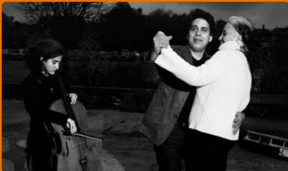
ur "En Stad För Alla", ett fotoprojekt på temat "Trygga människor i otrygga miljöer".